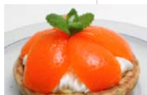
びわのタルトレット