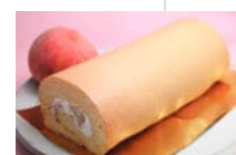
桃のロールケーキ