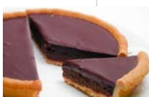
ショコラのタルト