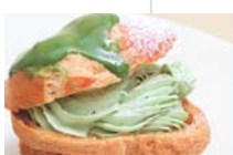
国産有機栽培抹茶の シュー・ア・ラ・クレーム