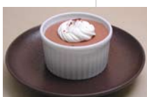
ショコラのムース