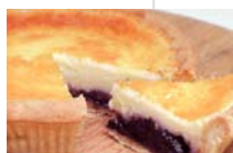
有機栽培ブルーベリーの タルト