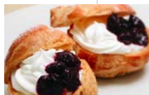
「シューまつり」開催！