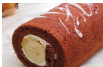
有機栽培バナナとチョコの