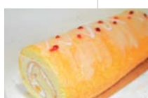
パッションフルーツの ロールケーキ