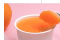
みかんのレアチーズ