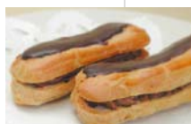
チェリーの シュー・ア・ラ・クレーム