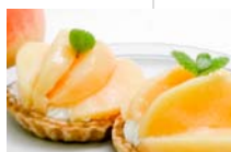
桃のタルトレット