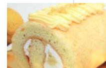
国産有機栽培レモンの