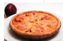
いちじくのタルト