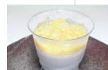
パッションのムース