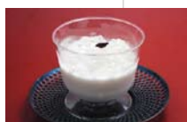
オーガニックコーヒーの ブランマンジェ