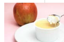
林檎のレアチーズ