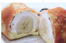
有機栽培バナナのクレープ